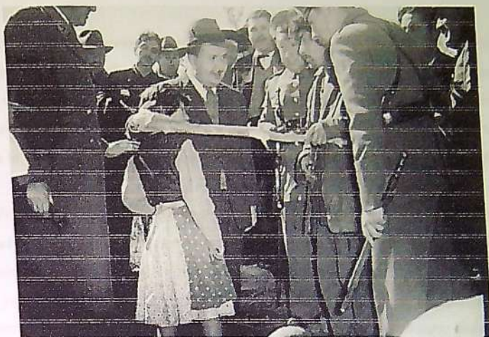
Una de las visitas policiales a la zona de Nahueltoro.