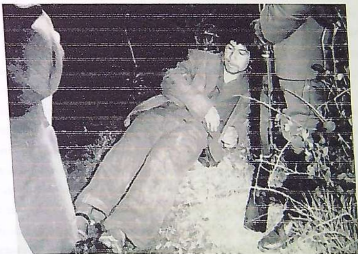
Reconstitución de escena