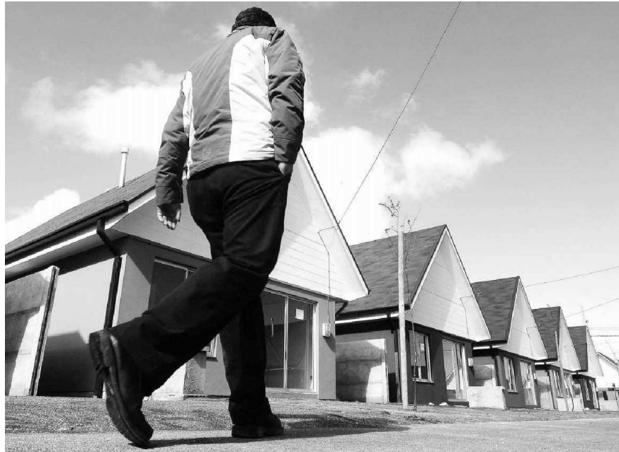
El terremoto motivó un éxodo de algunos habitantes de Concepción a Nuble. Además que el nuevo foco de viviendas este dirigido a la clase emergente.

"En términos psicológicos y sociales, probablemente generará algunos datos interesantes, como el tema de la opción sexual que está bastante oculta u otros temas también, como la composición de la familia, ya que en Chillán tenemos la idea que la familia es la madre, el papá, hijo e hija. Lo que encontraremos en reali-