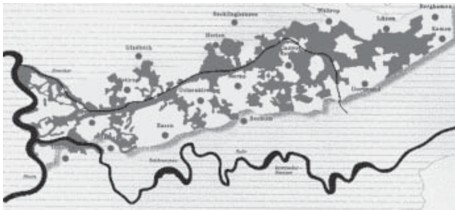
FIGURA 1. IBA Emscher Park, Paisaje y ciudades.

c) Los parques patrimoniales se presentan como una de las alternativas más válidas y contemporáneas de refuerzo de la identidad territorial. Pueden ser analizados como encadenamiento de elementos o áreas patrimoniales con características históricas similares, pero al mismo tiempo deben ser vistos como un cambio cualitativo de la conservación de la identidad territorial. Los parques patrimoniales proporcionan una amplitud territorial y una integración cultural entre ciudades y paisajes pocas veces alcanzada. Esta trascendencia de escala