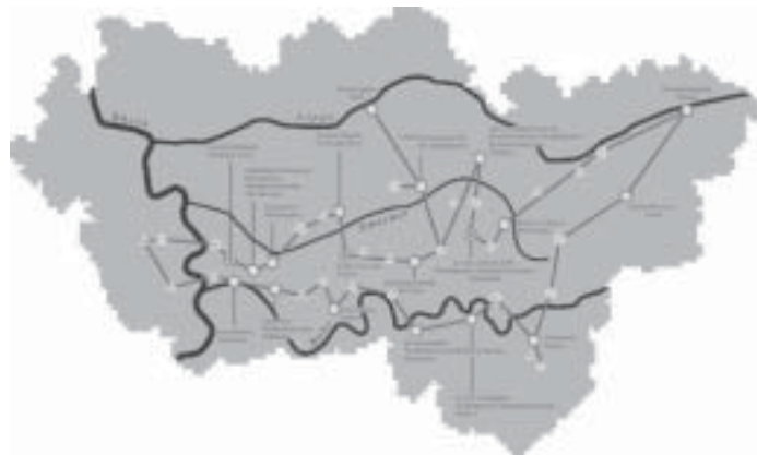
FIGURA 4. Ficha tipo. Todos los proyectos analizados han sido ordenados en fichas individuales que contienen planos y fotografías con el objetivo de comunicar visualmente su contenido, además de un resumen con datos homogéneos que explican cada proyecto.