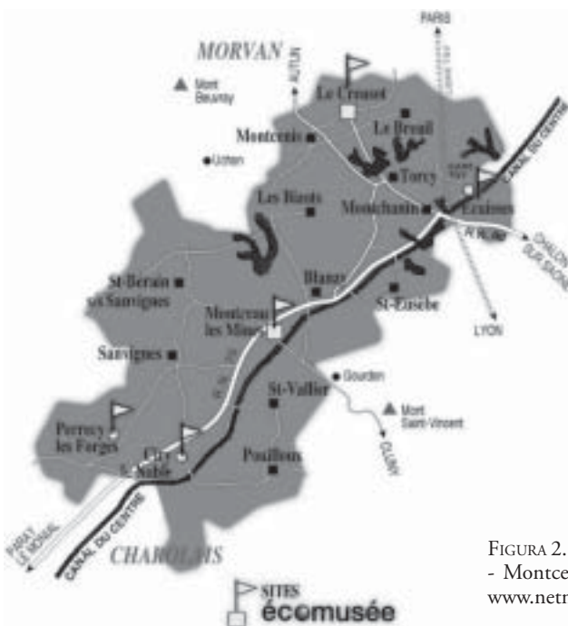
FIGURA 2. Ecomusée de la communauté urbaine Le Creusot - Montceau-les-Mines, Sitios y ciudades.